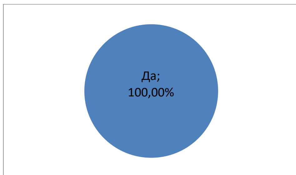
Рис. 7. Результаты готовности в настоящее время принимать выпускников на работу

На вопрос «Намерены ли Вы в настоящее время и в будущем принимать выпускников на работу?» - ответ «Да» дали 100% опрошенных работодателей.