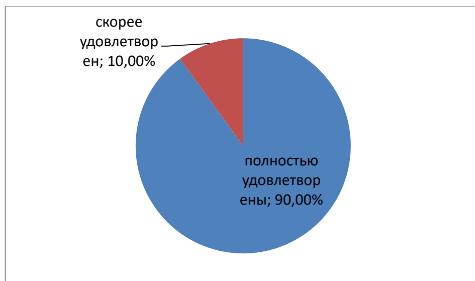
Рис. 3. Результаты оценивания уровня теоретической подготовки студентов (выпускников)

На вопрос «Как Вы оцениваете уровень теоретической подготовки студентов (выпускников)?» - дали следующие ответы: 90% полностью удовлетворены, а 10% скорее удовлетворены теоретической подготовкой студентов (выпускников).