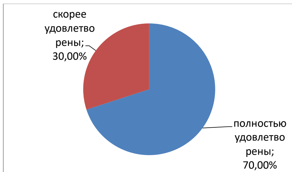
Рис. 6. Результат удовлетворенности коммуникативными качествами студентов (выпускников)

На вопрос «Удовлетворены ли Вы коммуникативными качествами студентов (выпускников)?» - 70% полностью удовлетворены коммуникативными качествами студентов (выпускников), а 30% скорее удовлетворены.