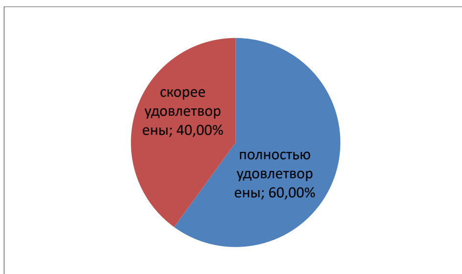
Рис. 5. Результаты удовлетворенности трудовой дисциплиной

На вопрос «Удовлетворены ли Вы трудовой дисциплиной студентов (выпускников)?» - 60% полностью удовлетворены, так же 40% ответили, что скорее удовлетворены.